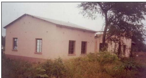
KBC Leslokaal met keuken

Gebouwen: Het klaslokaal met keuken (foto hieronder) is in maart opgeleverd. Het voorlichtingsgebouw is bijna klaar en wordt in september afgerond. Klanten en schoolklassen kunnen daar zien wat er allemaal bij het imkeren komt kijken. Met het slaapgebouw kan een begin worden gemaakt, maar er is € 50.000 nodig.